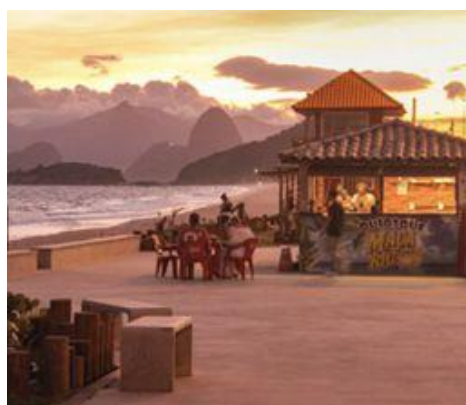
Foto: Quiosque em Piratininga.

Para chegar à Praia de Piratininga, pode-se ir de ônibus ou carro. Há várias linhas de ônibus para a região, entre elas a OC1 (Oceânica 1), 39A (Piratininga- Centro), 54 (Sapê- Piratininga) e 55A (Várzea das Moças-Piratininga). O ponto de descida é próximo à praia, a uma caminhada leve de distância.