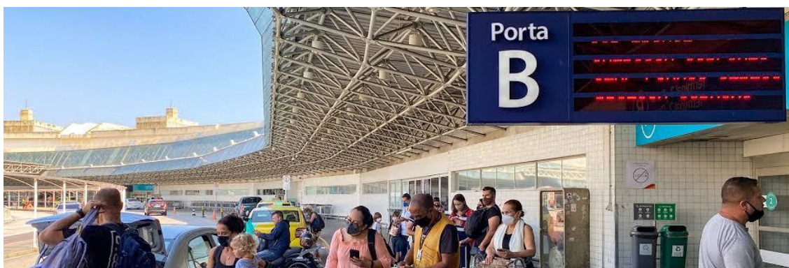
Entrada Aeroporto Tom Jobim.

Quem desembarcar no Aeroporto Internacional Tom Jobim pode pegar o 760D, que também vai direto para Niterói. A tarifa é a também é R$10,65. Para mais informações, clique aqui .