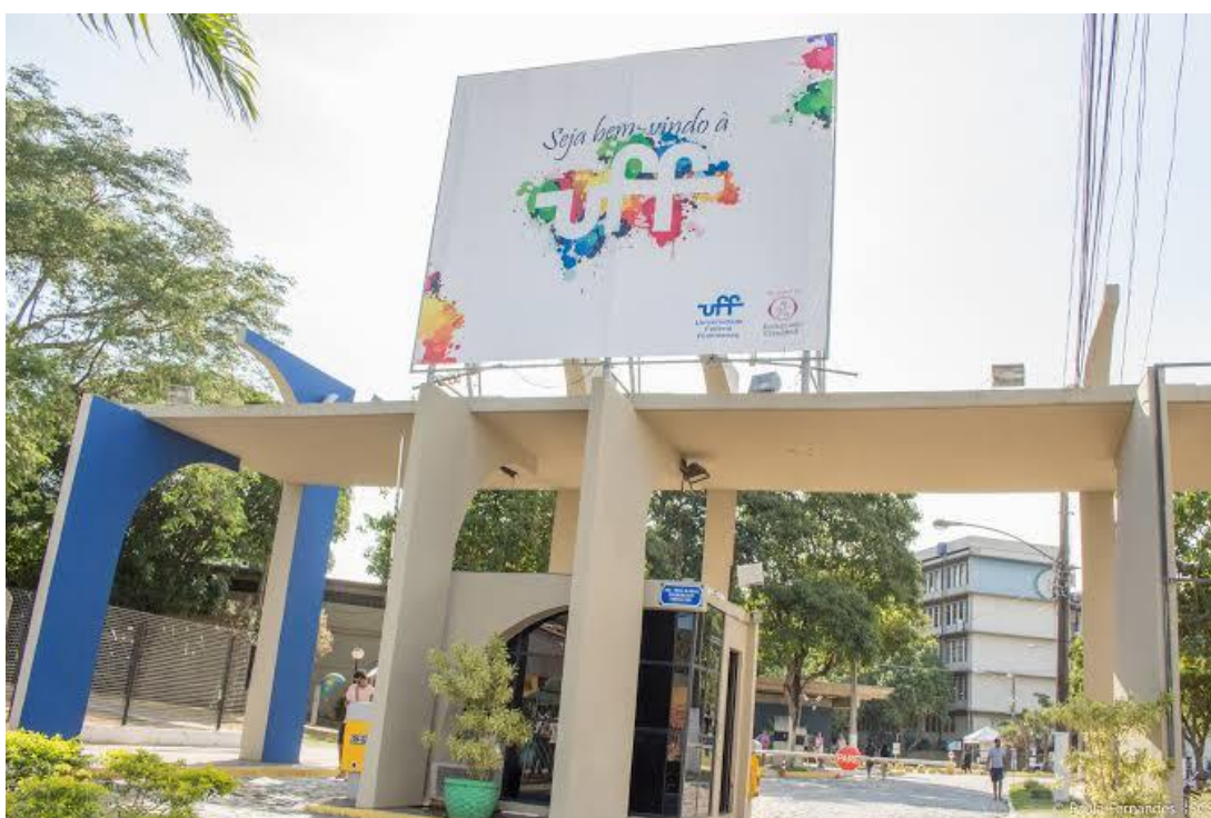
Entrada Campus Gragoatá.

Ao desembarcar no Rio de Janeiro, o visitante de primeira viagem precisa saber como se deslocar até seu local de hospedagem e depois chegar ao Campus do Gragoatá, onde acontece o XIV Encontro Nacional da Alcar. Separamos informações básicas para quem vier de avião ou ônibus e precisar se deslocar para Niterói.