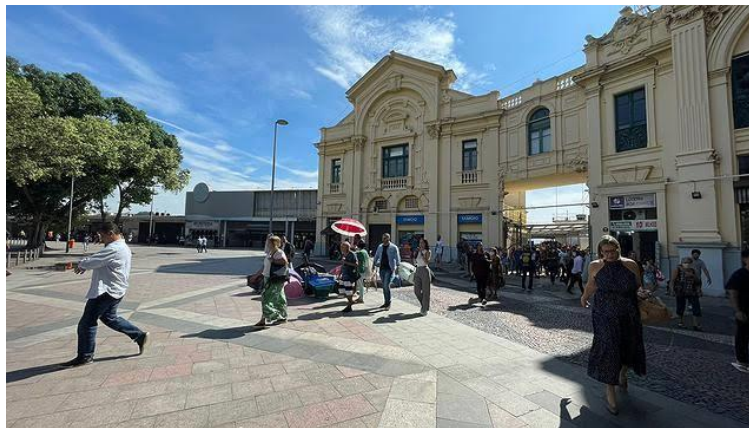
Estação Praça XV das Barcas.

Quem chega ao Rio de ônibus desembarca na Rodoviária Novo Rio, também situada no Centro, a 3 km da estação das Barcas e 15 km de Niterói, atravessando a Ponte. Os ônibus diretos para Niterói são o 755D (R$ 10,65) e o 100 (R$ 6,05). Com trânsito bom, o trajeto pode ser feito em 40 minutos. Para mais informações, clique aqui .