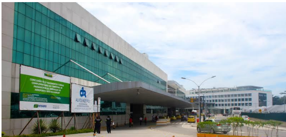
Entrada Aeroporto Santos Dumont.

Quem desembarcar no Aeroporto Internacional Tom Jobim pode pegar o 760D, que também vai direto para Niterói. A tarifa é a também é R$10,65. Para mais informações, clique aqui .